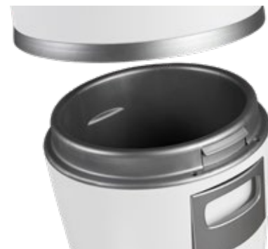
Suuri ja tilava roskasäiliö pikakiinnityksellä

Pölypussin käyttö roskasäiliössä tekee roskien tyhjentämisestä entistä hygieenisempää ja siistimpää. Pölypussi on saatavana lisävarusteena kaikkiin malleihin.